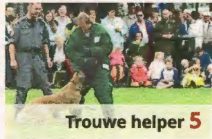
Trouwe helper 5